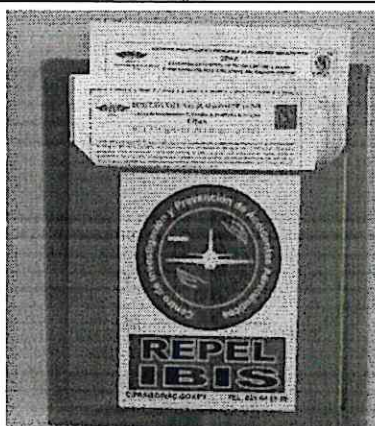
Inspección de formularios REPEL.