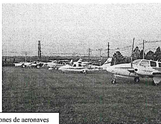
Plataforma de operaciones de aeronaves